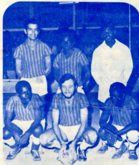
FUTEBOL DE SALÃO EQUIPA DO SINDICATO

CABINDA - 10.9.1972 - Para o Campeonato de Futebol de Angola da 2 a . Divisão: Sport. de Cabinda - 6 Golungo Alto - 0.