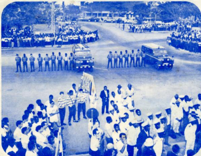
UM ANO NO GOVERNO

Como os leitores estão a ver, o Chefe é absolutamente necessário. Um provérbio português diz que "tudo é vento se não há rei