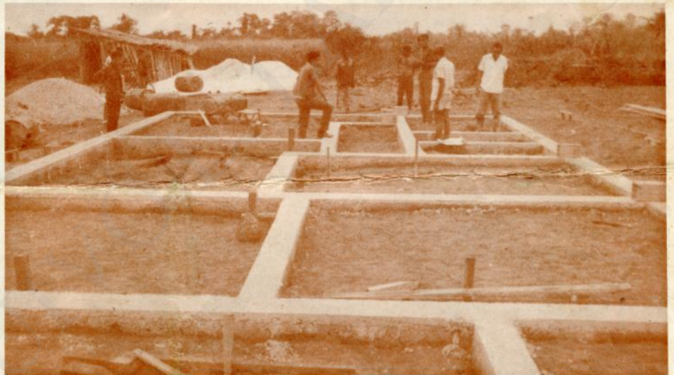
POSTO SANITÁRIO DE LOANGO PEQUENO (em construção)

O Distrito de Cabinda continua, pois, a estar na mente dos responsáveis superiores pela Administração, tendo em vista o PROGRESSO que se pretende, com o trabalho e colaboração de todos.