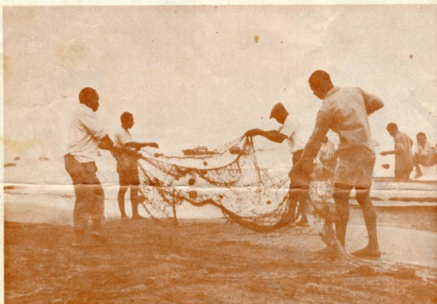
O TRABALHO DIGNIFICA O HOMEM

Sejamos todos cuidadosos e cumpridores das nossas obrigações, acautelando o futuro.