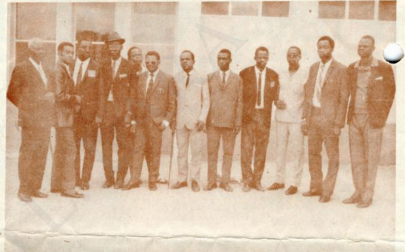
A CAMINHO DE LISBOA

cata lite - As mulheres deste povo, bem como as de Catabuanga, Chienze-Lite e Xinvula estão contentes por poderem trabalhar na colheita do café da Fazenda SITULO, onde ganham dinheiro, para podem melhorar a sua vida.