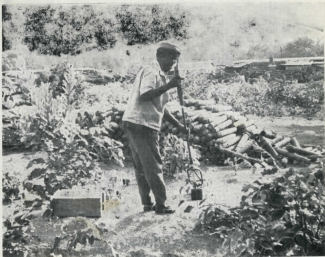
Après la prise du camp retranché de Che-Che par nos combattants, nos sapeurs ont dû détecter et enlever les mines placées par les troupes portugaises autour du camp.