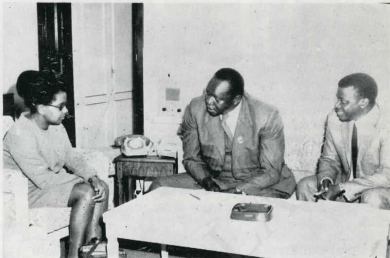
Le Général Idi Amin, Président de l'Ouganda, s'entretenant avec notre délégation.