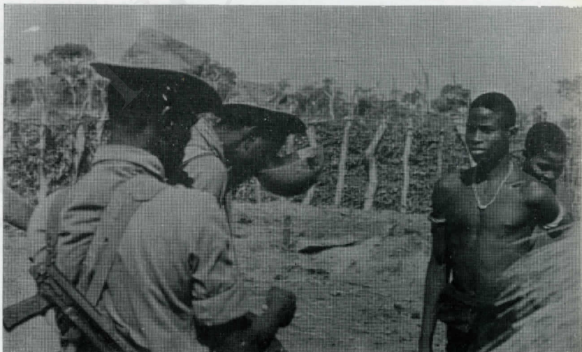
Le combattant, issu du peuple, trouve dans son appui, sa force principale.

de Mansaba-Farim et Farim-Jumbembem (au Nord, les 14 et 16 décembre) avec 12 morts et la destruction de deux camions et divers matériels de guerre, de Umolu-Anambe, Dara-Gabu et Xime-Bambadinca (à l'Est, respectivement les 17, 21 et 30 décembre), causant un total de 33 morts à l'ennemi, et la destruction des trois camions.