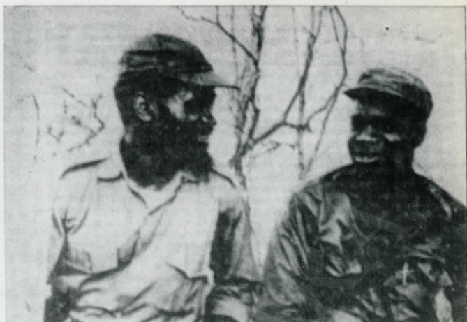
Le regretté Président Mondlane s'entretenant avec l'actuel Président du FRELIMO, Samora Machel, dans la province de Cabo Delgado, au Mozambique.