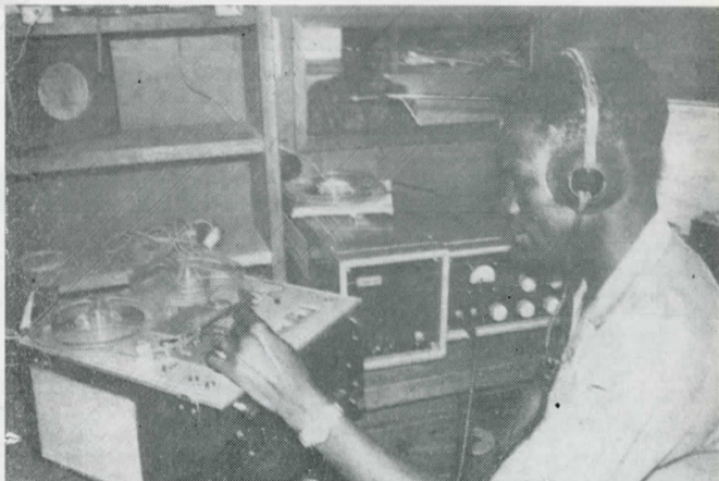
Le studio de notre Radio Libertação. Ses antènes ont diffusé le message du Secrétaire Général du Parti.

Les Portugais sains d'esprit, les vrais patriotes du Portugal, savent bien que nous n'avons jamais refusé ni ne refuserons la coopération des Portugais pour la construction du progrès de notre terre africaine, libre et indépendante. Les Portugais qui voudront collaborer avec nous, dans l'indépendance, seront les bienvenus. Cela le savent bien les courageux militaires portugais qui dans notre pays ou au Portugal, abandonnent la guerre coloniale.