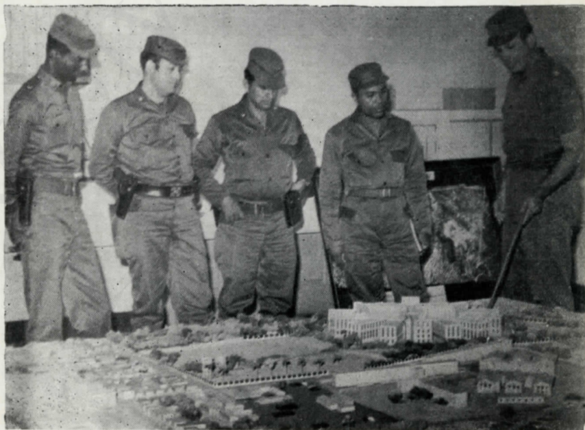
Camarade Luiz Cabral à l'Institut Technique Militaire de la Havane, en compagnie de quelques officiers de l'Armée cubaine.

Notre camarade Luiz Cabral, membre du Bureau Politique, fait une visite d'amitié à la République Socialiste de Cuba. Notre camarade a rencontré plusieurs dirigeants et responsables cubains qui ont réaffirmé l'amitié et la solidarité du peuple de Cuba à l'égard de notre peuple eu lutte.